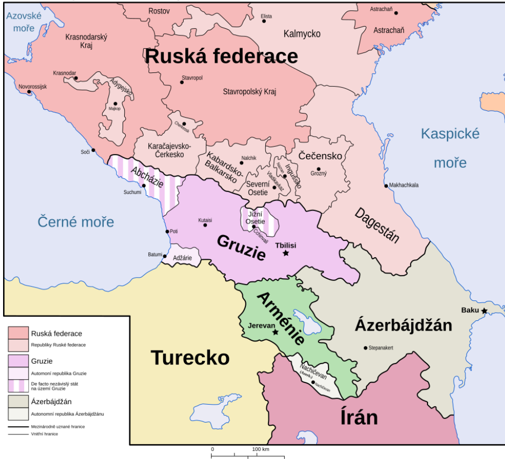
Politická mapa Kavkazského regionu (2025)